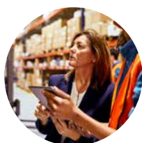
Ética e integridad

El presente “Código Ético y de Conducta de Proveedores, Subcontratistas y Colaboradores del Grupo Ecnor” , que se desarrolla a partir del Código Ético y de Conducta del Grupo Ecnor (disponible en su página web corporativa ( www.ecnor.com )) para cualquier persona u organización que se relacione con el mismo o que tenga un interés legítimo), se configura, por tanto, como la herramienta fundamental del Grupo Ecnor para promover que sus proveedores, subcontratistas y colaboradores realicen sus actividades conforme a las mejores prácticas empresariales y estándares éticos.