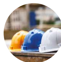
Seguridad y salud