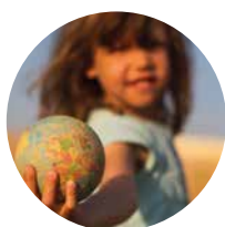
Defensa de los derechos humanos, sociales y laborales